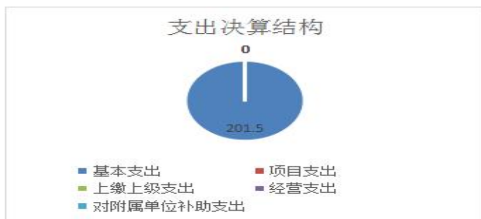
图 3: 支出决算结构